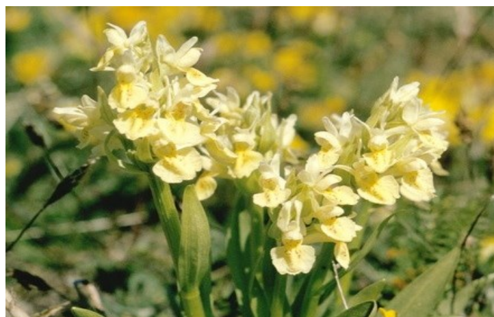
Telemarks fylkesblomst søstermari- hand veks på Langeskor- plassen

Langeskor har ein rik og interessant flora. Her finn vi den gule orkideen søstermarihand, som er Telemarks fylkesblomst. Dessutan kan vi finne vårmarihand og brudespore. Også kystplanta sørlandsvikke har funne seg ein leveplass her oppe. I Tjønnsuldalen finst sjeldne og raudlista soppartar som lys hårkjuke, rosenkjuke og rynkeskinn.