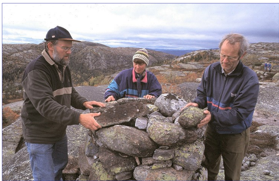
Bygging av turlagets jubileumsvarde.

Bryggefjell er den mest markerte delen av Lifjell sett frå Bøbygda. Bø Turlag har blåmerka stiar opp dit både frå Innleggen øvst i Liheia og frå Breskelia her du nå står. Frå Bryggefjellnuten (786 moh.) er det strålende utsikt i alle retningar. Ein tur dit byr på dei finaste naturopplevingane ein kan tenke seg. Det er ikkje tilfeldig at Bø Turlags 20-årsjubileumsvarde blei bygd på denne nuten.