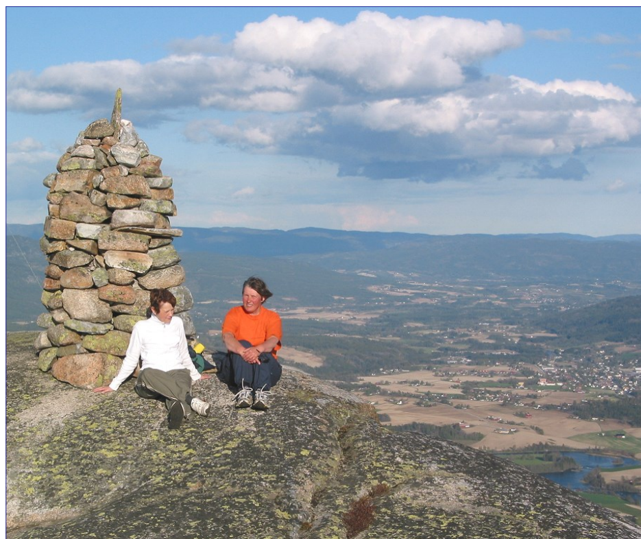
Utsikt frå varden mot Bøbygda.