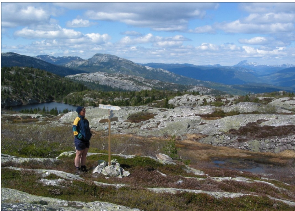
Frå Bukkelifjell mot Gaustatoppen.

Lengst nord i Bø og aust for Lifjell ligg Bukkelifjell og Trogafjell. Her finn vi tufter etter stular og plassar som vitnar om ein hardare kvardag enn vår. I vår tid har skogen teke over der det før var opne setervollar og beitemark, men snaue kollar, myrar, og blinkande små vatn liver opp i landskapet. Utanom dei merka stiane finst det umerka stiar og spennande "villmark" for det som ønskjer å ta seg fram på eiga hand.