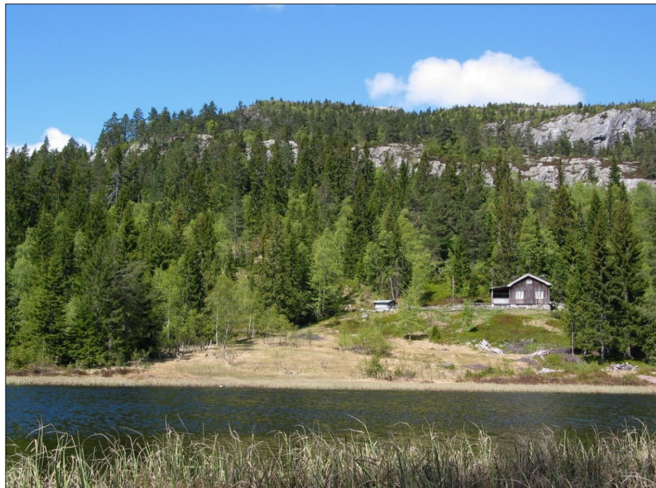
Løkjinn.