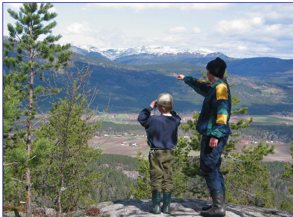
Høyslass mot Forberg, Liheia og Lifjell lengst bak.

Høyslassnuten. Følg skilt og merka sti heilt fram. Ved toppen av Bruskor vitnar utsprengt stein om skjerp etter molybden. Like under Høyslassnuten ved stien på austsida, finn du ei lita olle som ga kaldt godt vatn også i tørkesumaren 1947. Like ved plassen Skorra under Bruskor, har vi skilta til ein mura brønn.