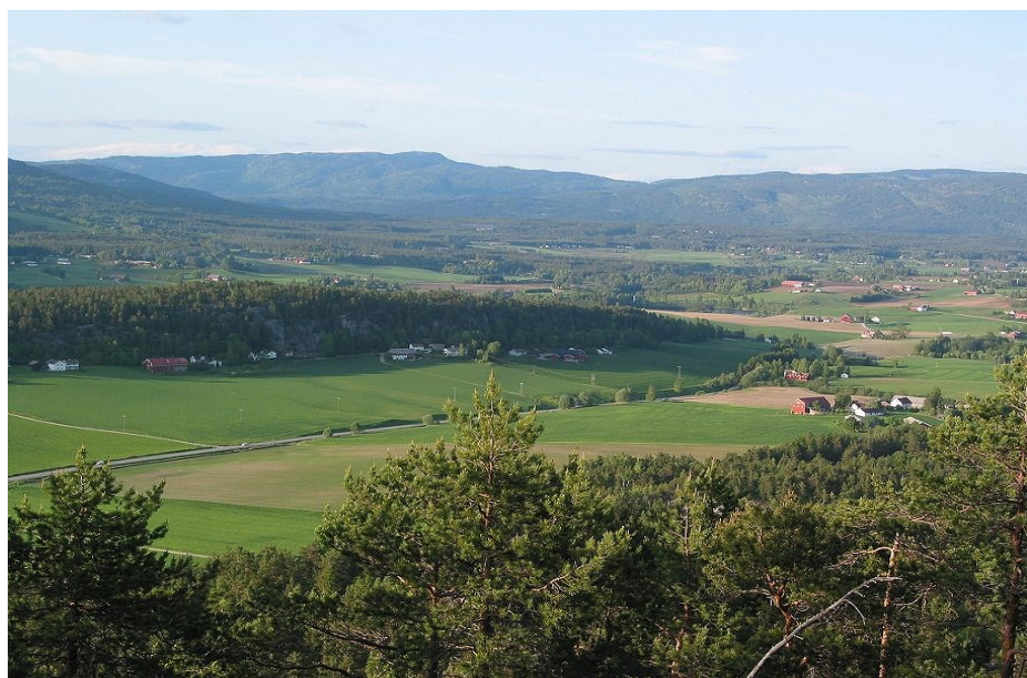
Utsyn frå stien bratt opp frå parkering ved Forverg – mot Forbergåsen og Bødalen bak.

Vi finn mange husmannsplassar som er avmerkt på kartet. Husa er borte, men framleis kan ein sjå tufter og steingjerde. På plassen Høyslass sto husa til ca 1930. På husmannsplassen Høymyrane hende tragedien som er fortalt i bygdeboka: Mannen døydde og kjerringa vart sparka i hel av hesten.