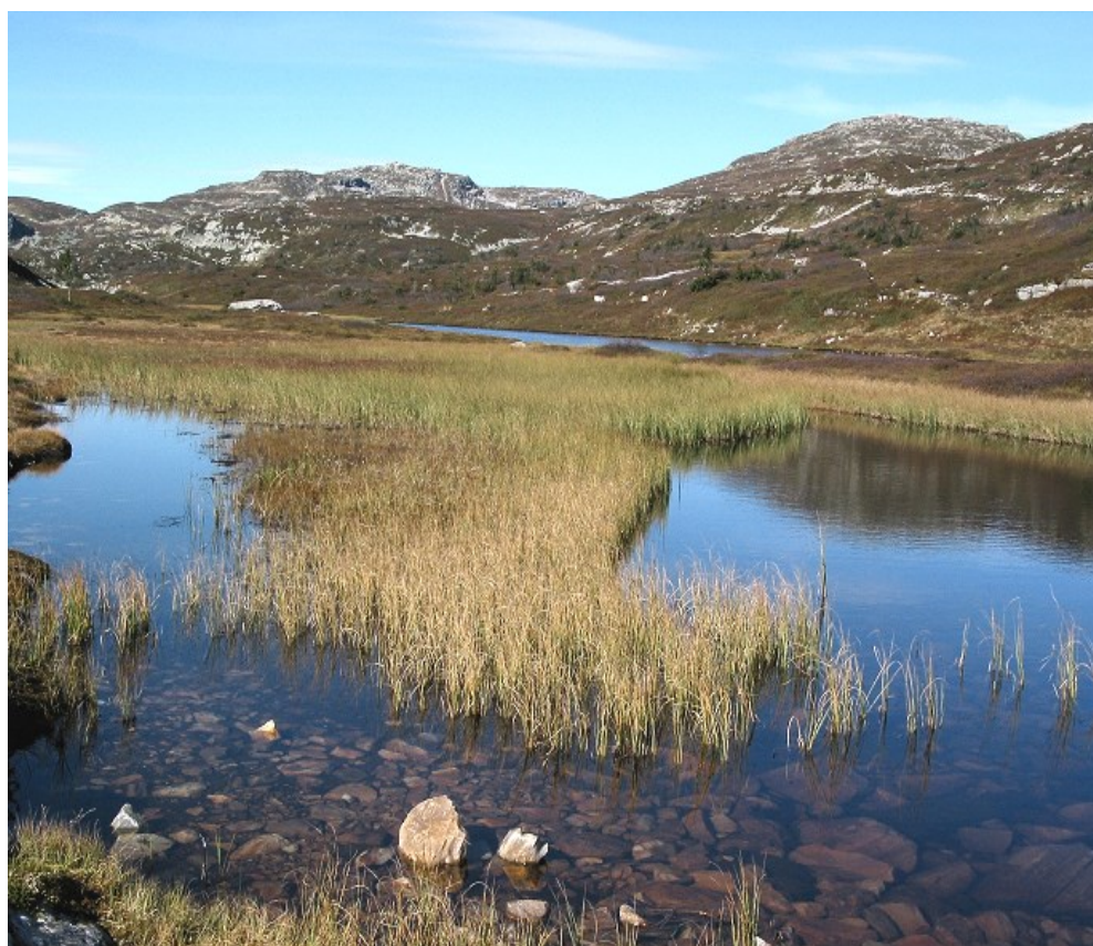
Frå Langetjønne.

For dei som ønskjer å gå utanom merkte stiar, kan vi tilrå ein tur over Røksbufjellet der Repetjønne lyser opp i landskapet og byr på fine rasteplassar. Under Valjuvsnatten ligg Valjuvshola. Segna fortel at ein hund forvilla seg inn i hola og kom ut igjen i Hjartdal - men da var pelsen svidd!