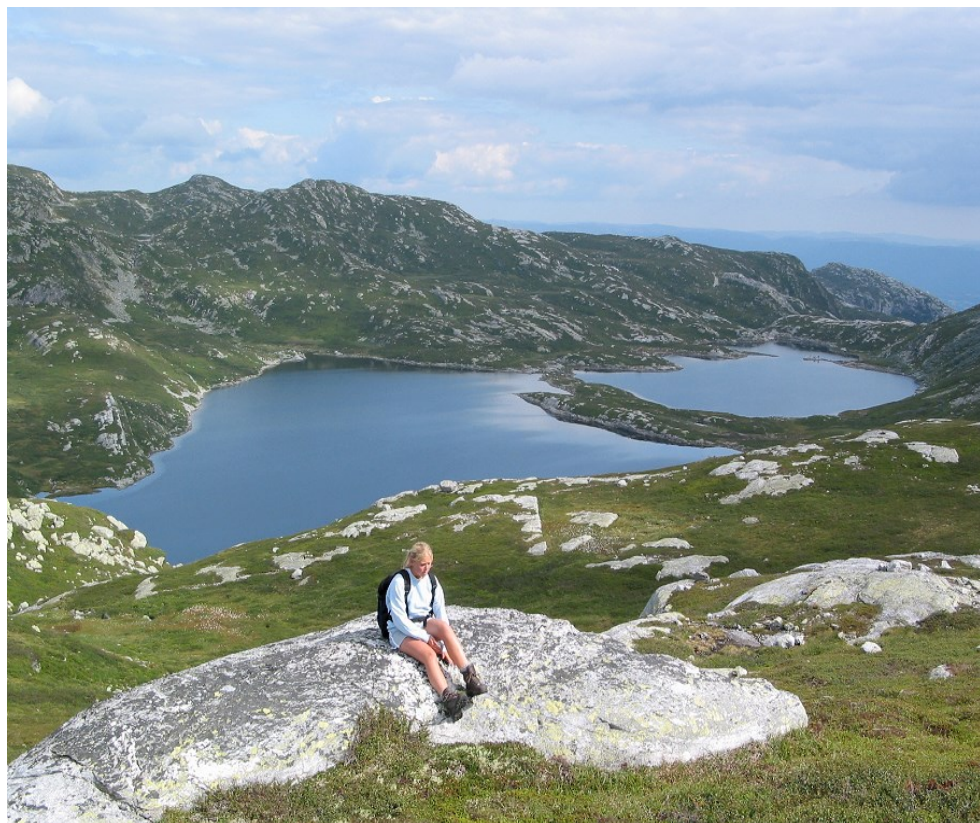
Utsikt mot Holmen